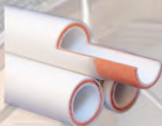
Полипропиленовые трубы, армированные стекловолокном

*Трубопроводы проложены скрыто в изоляции, в конструкции пола.