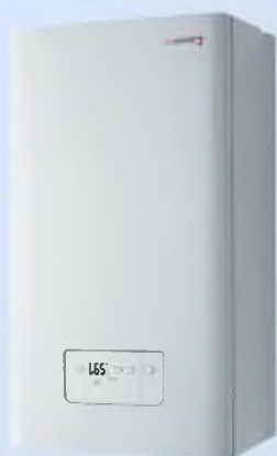
Газовый котёл Protherm MTV 23 (23 кВт)