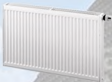
Стальные панельные радиаторы Rommer тип 22 высота 500 мм.